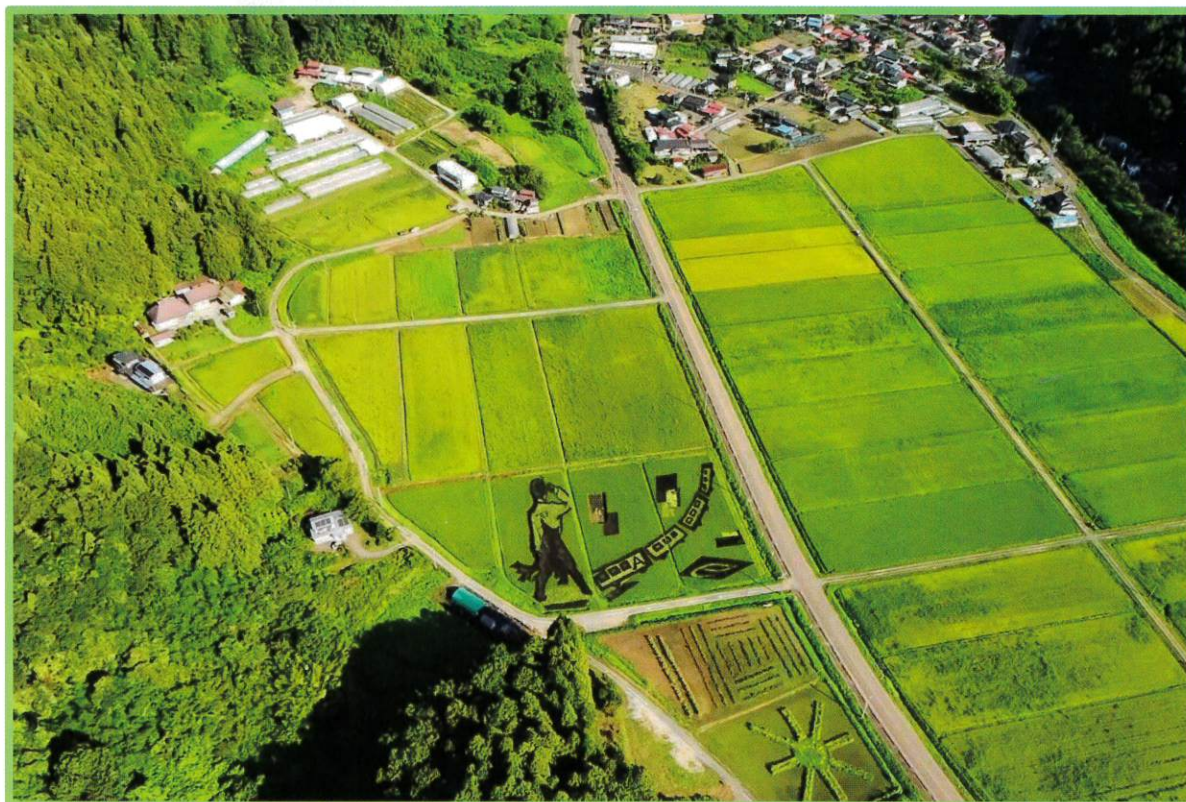
西根田んぼアート：羽生結弦さんのマスディスと阿武隈急行線