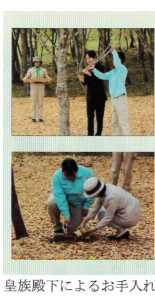
皇族殿下によるお手入れ

会場へのアクセスは、計画バスに限られており、白石市「白石城下広場」からのバスによる入場となりました。式典前には、出席者全員によるブナへの施肥が行われ、アトラクションとして「福祉姉妹」による津軽三味線の演奏が披露されました。