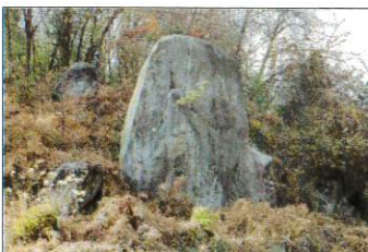
子供が「えーん」「えーん」と泣く声を角田の方言で「ほーいほーい」と言う。この岩が泣いている顔の様に見えるから呼ばれた(角田市HPより)

現場へは角田市南西部に位置し、森林が広がるエリアです。高さ10mの巨石「笠島の立石」があり「ホイホイ岩」の愛称で呼ばれています。