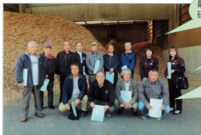
ウッドリサイクルセンターにて