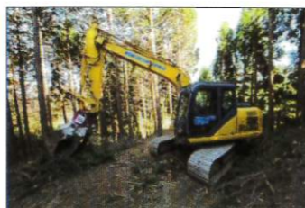
作業は、奥の方で行っており作業員と直接話が聞けなかったのは残念でした

現場へは角田市南西部に位置し、森林が広がるエリアです。高さ10mの巨石「笠島の立石」があり「ホイホイ岩」の愛称で呼ばれています。